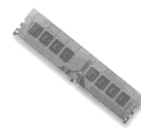
4x DDR4 max. 64GB