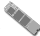
M.2 2280 Support