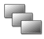
Triple UHD Display