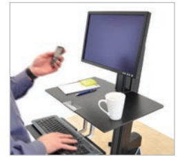
Arbeitsfläche für WorkFit-S 97-581-019 (schwarz)

WorkFit LCD & Laptop-Konvertierungs-kit von Dual-Displays 97-617 Dieses Kit dient der Konvertierung einer WorkFit-S, WorkFit-C oder WorkFit-A Dual-Workstation zu einer WorkFit LCD & Laptop-Workstation