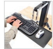
Große Tastaturablage WorkFit-S 97-653 (schwarz)