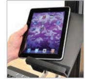
Tablet-/Dokumenthalterung für WorkFit-S 97-558-200 (schwarz) mit Griff zum Anheben