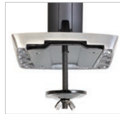
Befestigungsteile für optionale Schraubplattenbefestigung zur flexiblen Montage im Lieferumfang enthalten