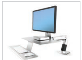
WorkFit-A mit tiefer gelegter Tastaturablage, Platin