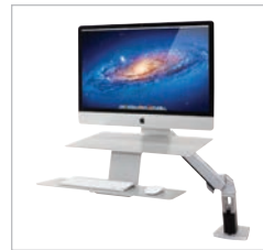
Mit Apple 21-27" iMac-Modellen mit integriertem VESA-Halterungsadapter (von Anfang 2013 bis Heute) kompatibel. Für Einzelheiten siehe die Website.