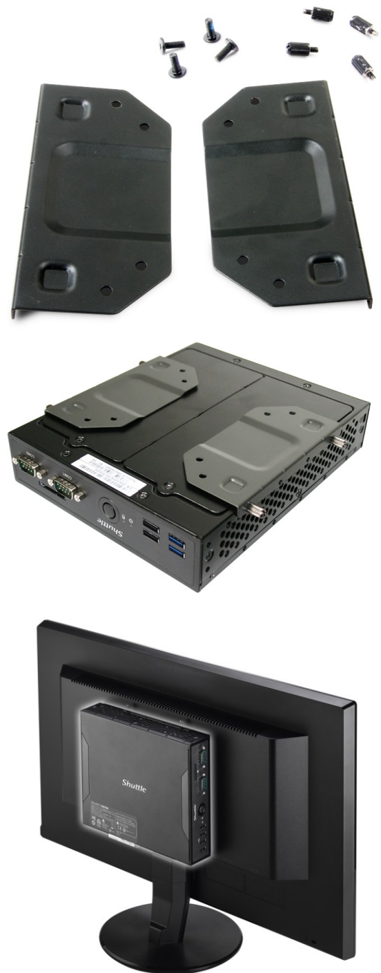
Die Abbildungen dienen nur zur Illustration