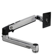
POLIERTES ALUMINIUM MIT SCHWARZEN ELEMENTEN #97-940-026

FÜR DAS HINZUFÜGEN EINES DRITTEN UND VIERTEN ARMS ZUR HOHEN STÄNDERVERSION ERFORDERLICH