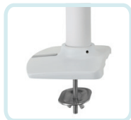
ZUBEHÖR FÜR WEISSES HALTERUNGSKIT 98-083 MIT KABELDURCHFÜHRUNG: WIRD DURCH EINE OBERFLÄCHENÖFFNUNG ANGEBRACHT