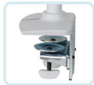
ZUM DUAL GESTAPELTEN LX-ARM MIT HOHEM PFAHL GEHÖREN: EINE ZWEITEILIGE HEAVY-DUTY-TISCHKLEMME, DIE AN DER OBERFLÄCHENKANTE ANGEBRACHT WIRD