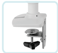
ZUM DUAL GESTAPELTEN LX-ARM ENTHALTEN: 2-TEILIGE STANDARD-TISCHKLEMME, DIE AN DER OBERFLÄCHENKANTE ANGEBRACHT WIRD