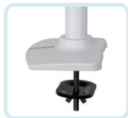
DIE HALTERUNG MIT KABELDURCHFÜHRUNG, DIE DURCH EINE OBERFLÄCHENÖFFNUNG ANGEBRACHT WIRD