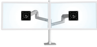
DIE STANDARDKONFIGURATION IST FÜR ZWEI BILDSCHIRME AUSGELEGT