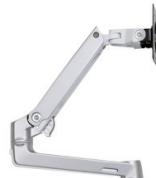
SILBER MIT WEISSEN ELEMENTEN #98-130-231