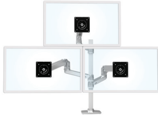
ABGEBILDET MIT EINEM LX-ARM, EINER VERLÄNGERUNG UND EINEM FASSUNGSSATZ FÜR DREI BILDSCHIRME