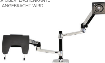
DAS GEZEIGTE NOTEBOOK-ABLAGE-KIT WIRD STANDARDMÄSSIG MIT DEM DUAL GESTAPELTEN POLIERTEN ALUMINIUMARM #45-248-026 MITGELIEFERT

BEI DEN WEISSEN DUALEN LX ARMEN KANN DAS NOTEBOOK-ABLAGE-KIT #50-193-200 (NUR SCHWARZ) SEPARAT BESTELLT WERDEN