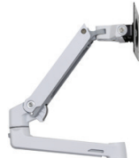
WEISS MIT GRAUEN ELEMENTEN #98-130-216